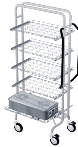
DTO シングル (シェルフ) 商品コード：564718570 (コンテナは付属されません)

Getinge SMART オープンディストリビューシヨントロリーはシングルとダブルのそれぞれのモデルからお選びいただけます：