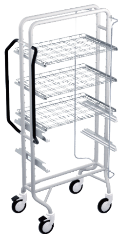
DTO シングル (ミックス) 商品コード：564718370