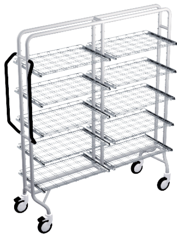
DTO ダブル (シェルフ) 商品コード：564718970