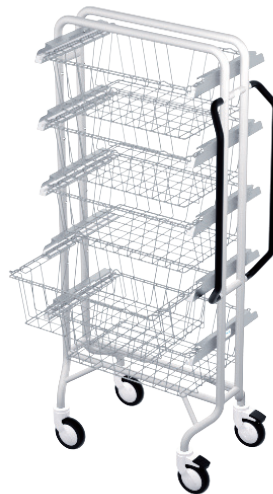
DTO シングル SPRI (5 段) 商品コード：564718170 (バスケットは付属されません)