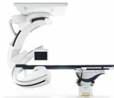
Canon Medical Systems