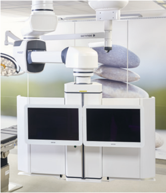
Die rückseitige EPoS-Zubehörschiene ermöglicht die Anbringung von Zubehörkomponenten, wie zum Beispiel eine Aufnahme für einen oder zwei Backup-Monitore.