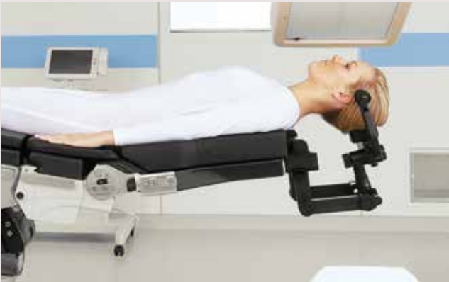
Durchleuchtbares Zubehör – wie die Schädelklemme für neurochirurgische Operationen und Eingriffe an der Wirbelsäule – ist auf maximale Kompatibilität mit intraoperativen Bildgebungsverfahren ausgelegt.