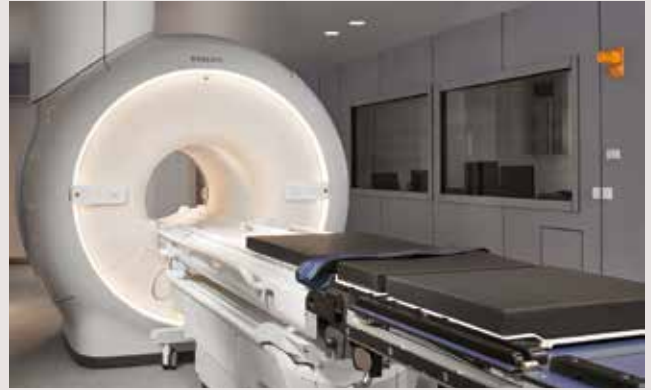
Die Maquet Otesus und Maquet Magnus Transfer-Lagerflächen von Getinge sind mit der Philips Ingenua MRT-OP-Lösung für intraoperative Kontrollen oder Diagnosezwecke kompatibel.