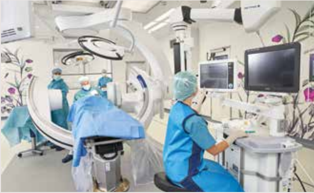
Philips Azurion mit FlexArm ist das neueste Angiographiesystem, das vollständig mit dem Maquet Magnus OP-Tisch integriert werden kann.