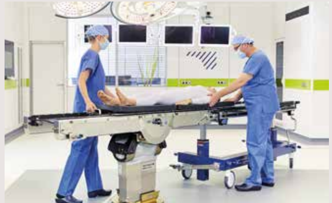
Die spezielle Lagerfläche des Maquet Magnus ermöglicht den Transfer zum MRT ohne Umlagerung des Patienten.