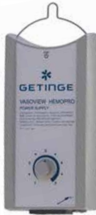
MAQUET Vasoview Hemopro-Netzteil