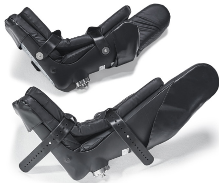
Standard-Beinschalen (schwarz) für Patienten bis 160 kg

Patientenkomfort: Mithilfe der Klingenaufnahme kann das Bein des Patienten näher am Rotationspunkt der Hüfte gelagert werden. Das reduziert die Belastung für Patienten, die einen eingeschränkten Bewegungsradius im Hüftgelenk haben. Die Beinschalen sind standardmäßig mit Seitenflügeln ausgestattet, um die Stabilität des Beins des Patienten zu verbessern und zu verhindern, dass das Bein nach außen wegrutscht.