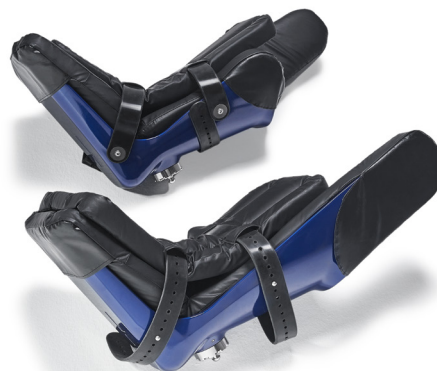
Adipositas-Beinschalen (blau) für Patienten bis 250 kg

Patientenkomfort: Mithilfe der Klingenaufnahme kann das Bein des Patienten näher am Rotationspunkt der Hüfte gelagert werden. Das reduziert die Belastung für Patienten, die einen eingeschränkten Bewegungsradius im Hüftgelenk haben. Die Beinschalen sind standardmäßig mit Seitenflügeln ausgestattet, um die Stabilität des Beins des Patienten zu verbessern und zu verhindern, dass das Bein nach außen wegrutscht.