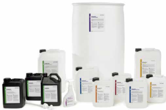
Getinge CLEAN 清洗剂系列

Getinge 集团在清洗剂和消毒剂开发领域有近 80 年的历史，已经形成了完整综合的产品系列以满足各种性能、效率和经济性的要求。我们提供的清洗剂和润滑剂系列在 Getinge 清洗消毒器中进行了全面测试和验证，最新的配方可以处理各种器械清洗问题，如预处理、生物膜的去除和复杂的微创器械的清洁等。