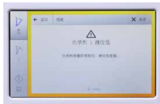
屏幕上显示指导信息